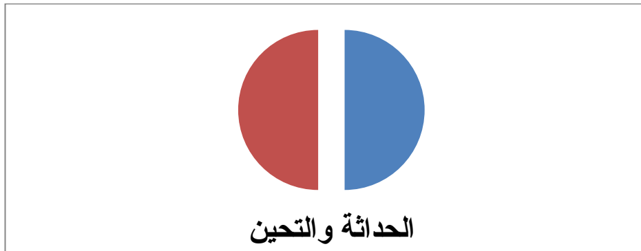
شكل رقم 2: دائرة نسبية ٥٠٪ تمثل النسب متفاوتة لمعيار الحداثة

وقد مثلنا النسب متفاوتة في دوائر نسبية وهي على التوالي: