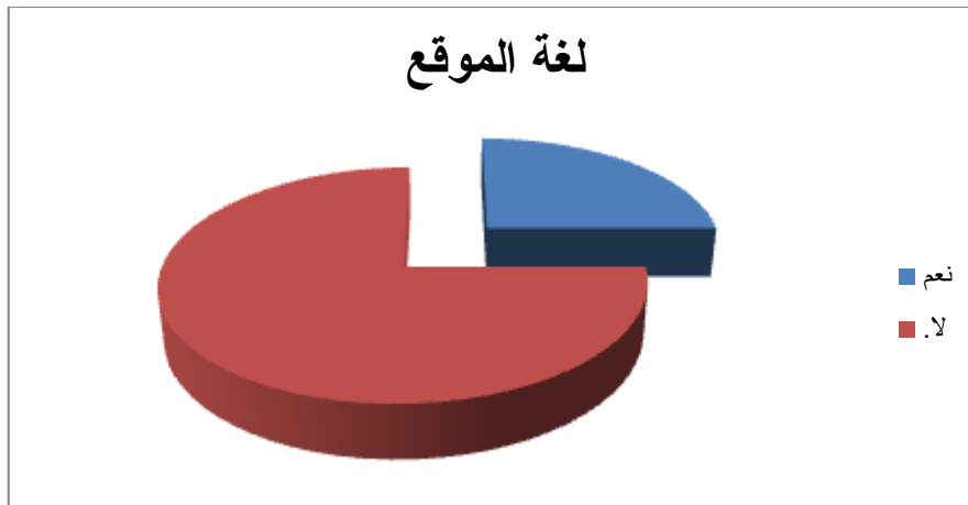
شكل ٠4: دائرة نسبية ٠٤ تمثل نسبة لغة الموقع

كذلك تمثل هذه الدائرة نسبة الخدمات التفاعلية والذي بين نسبة التفاعلية في الموقع حسنة نوعا ما حيث يوفر البريد الإلكتروني وجماعات النقاش ومحرك البحث الذي يوفر البحث والإسترجاع داخل الموقع غير انه لا يضع الدروس التفاعلية والملتقيات حيث لو توافرا لكانت نسبة التفاعلية أعلى مع تبادل الخبرات والمهارات بين رواد الموقع.